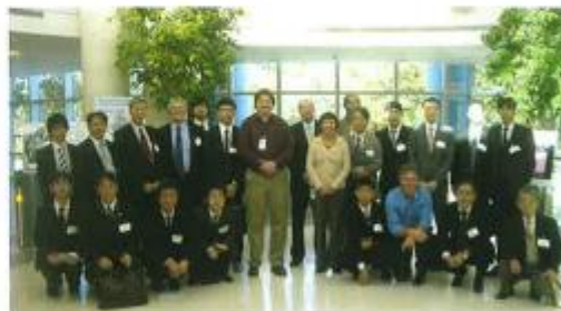
Affiliate members and hosts at GSK in Research Triangle Park, North Carolina.

Merck's Vaccine Bulk Manufacturing Facility (VBF) Program of Projects is the Facility of the Year Award (FOYA) Overall Winner for 2012. Located in Durham, North Carolina, the